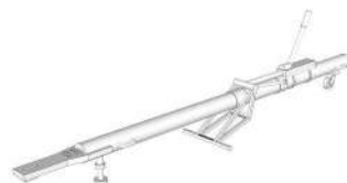
(6): Barra x1