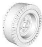
(2): Rueda Trasera x2