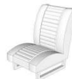
(5): Asiento x2