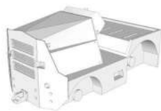
(1): Cuerpo x1